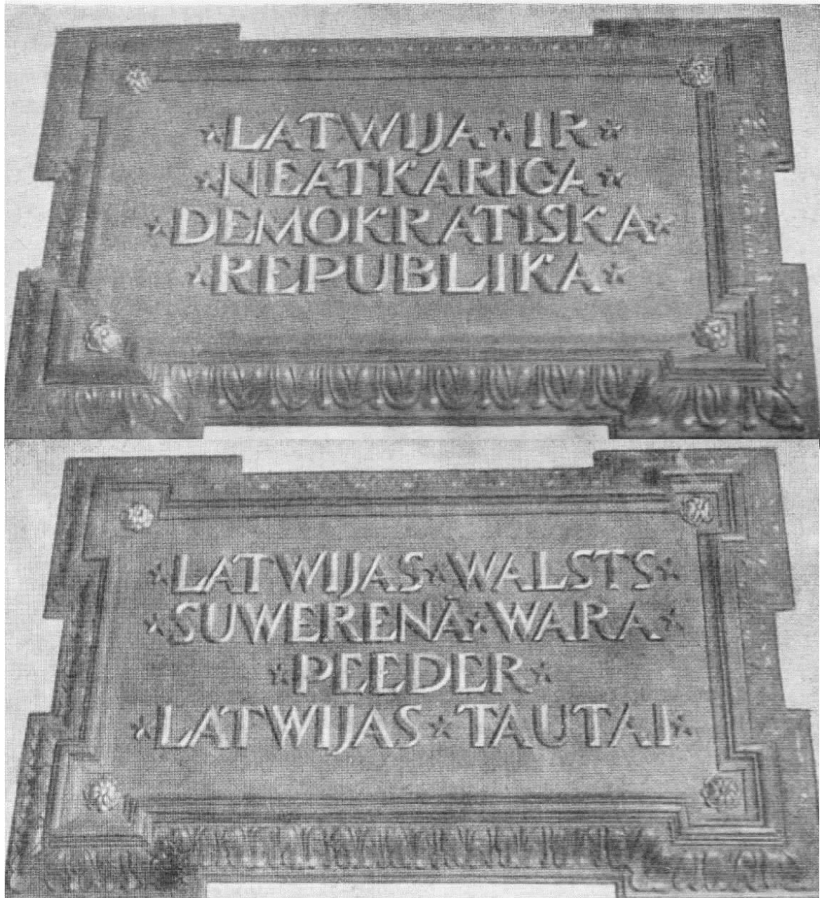
Satversmes 1. un 2.pantu plāksnes aiz Saeimas Prezidija sēdekļa Latvijas pirmsokupācijas periodā