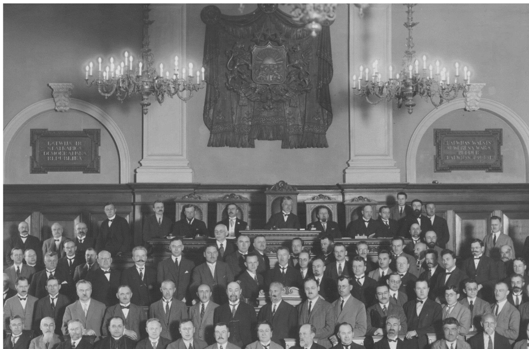
Latvijas Republikas 1. Saeimas pirmā sēde 1922. gada 7. novembrī