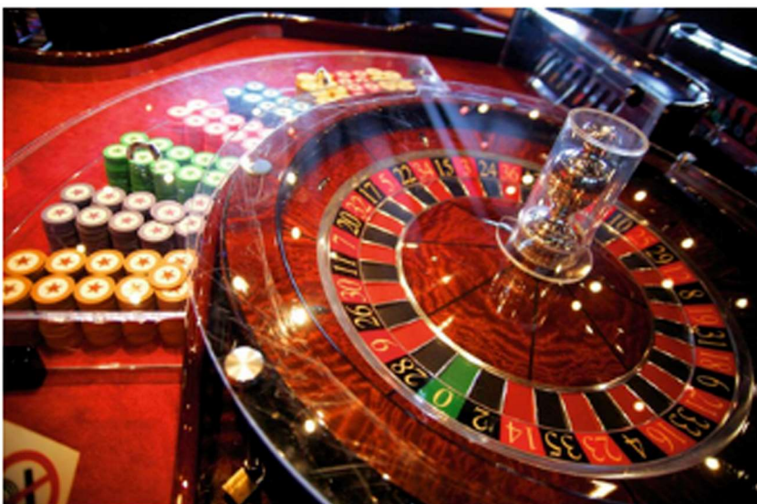
Ilustratīvs attēls

LE LETA 10:08, 18. februāris 2020 Komentāri